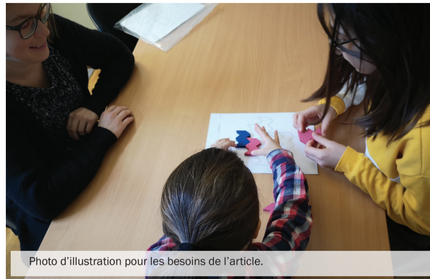
Photo d'illustration pour les besoins de l'article.

Des missions de prise en charge avec différents types d'intervention, comme par exemple une aide pour mieux expliquer son diagnostic à d'autres personnes, une aide à la mise en place de stratégies éducatives ainsi qu'une aide pour effectuer les démarches nécessaires dans le cadre de la recherche d'un emploi. De plus, le service propose différents ateliers-rencontres thématiques et groupes de compétences sociales en vue de favoriser l'échange entre familles concernées.