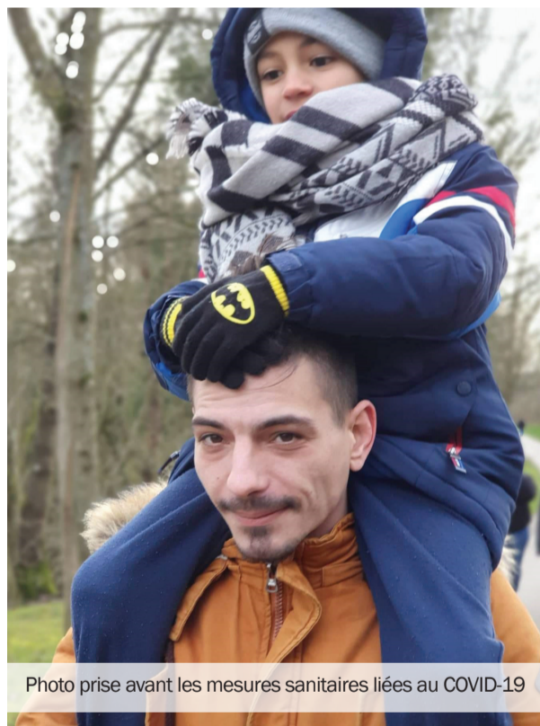
Photo prise avant les mesures sanitaires liées au COVID-19