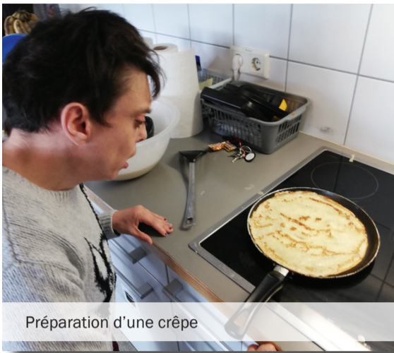
Préparation d'une crêpe

L'odeur de biscuits sortant du four. Les guirlandes de lumières colorées, qui scintillent sur les murs des maisons. Les yeux brillants des enfants, qui attendent leurs cadeaux dans la joie. Voilà plein de petites choses qui nous rappellent, ce qui est sans doute pour beaucoup d'entre nous, la plus belle période de l'année.