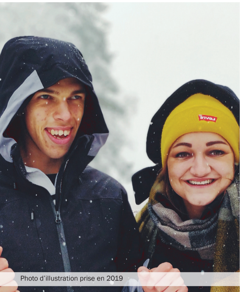
Photo d'illustration prise en 2019

ENSEMBLE, nous construisons des vies meilleures