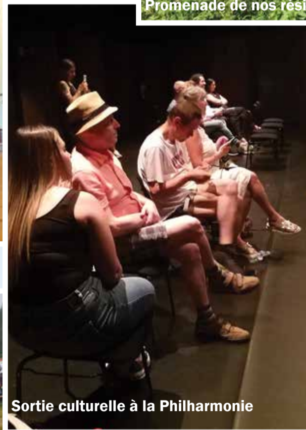
Sortie culturelle à la Philharmonie