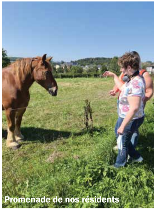
Promenade de nos résidents