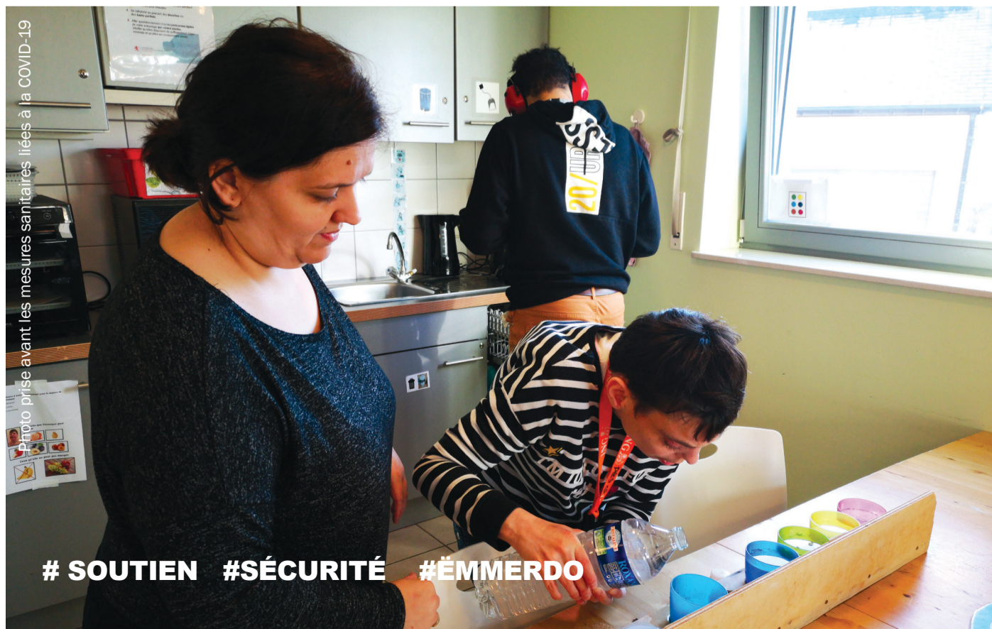
Photo prise avant les mesures sanitaires liées à la COVID-19