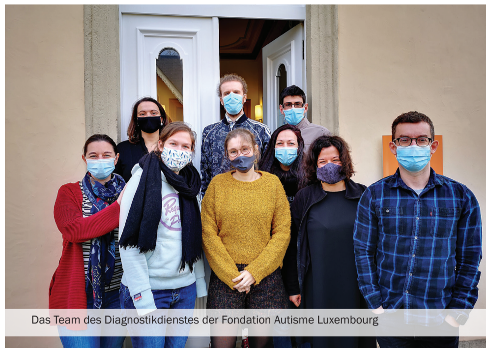
Das Team des Diagnostikdienstes der Fondation Autisme Luxembourg

Nur, wenn man versteht, was man genau hat und welche Auswirkungen das Handicap auf die verschiedenen Lebensbereiche haben kann, kann man sich die richtige Unterstützung in diesen Bereichen anfragen“, berichtet eine junge Frau, die erst vor Kurzem ihre Diagnose Autismus erhalten hat.