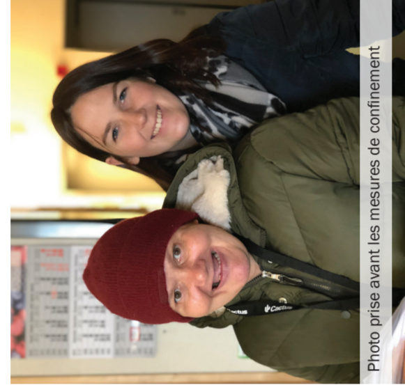
Photo prise avant les mesures de confinement