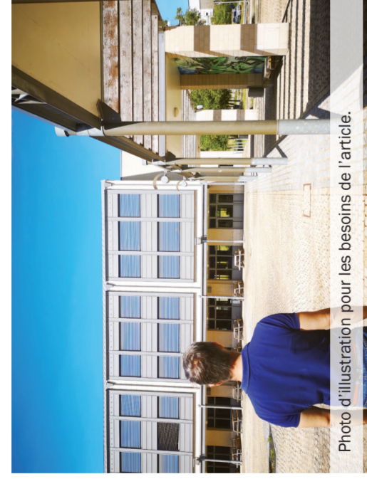
Photo d'illustration pour les besoins de l'article.

Je me rappelle aussi de cette classe où la majorité était contre moi. Ma mère a bien