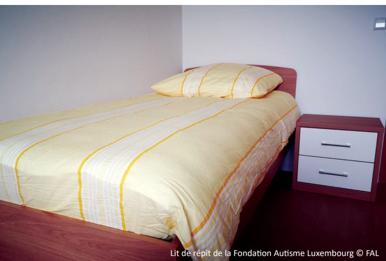
Lit de répit de la Fondation Autisme Luxembourg

Dir musst verstoen, wann een ee Kand mat Autismus an nach een anert Kand ouni