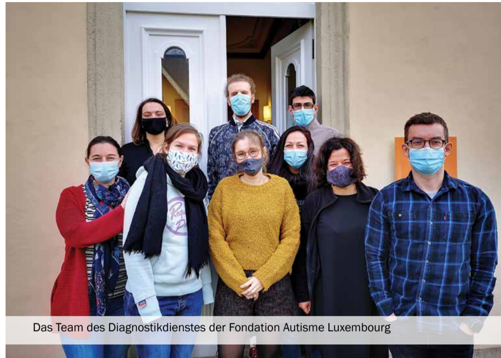
Das Team des Diagnostikdienstes der Fondation Autisme Luxembourg

Wurde eine klare Diagnose erhalten, kann sie den betroffenen Familien bereits sehr viel helfen: „Nach der ersten Zeit der Akzeptanz stellt die Diagnose Autismus für die meisten Familien eine große