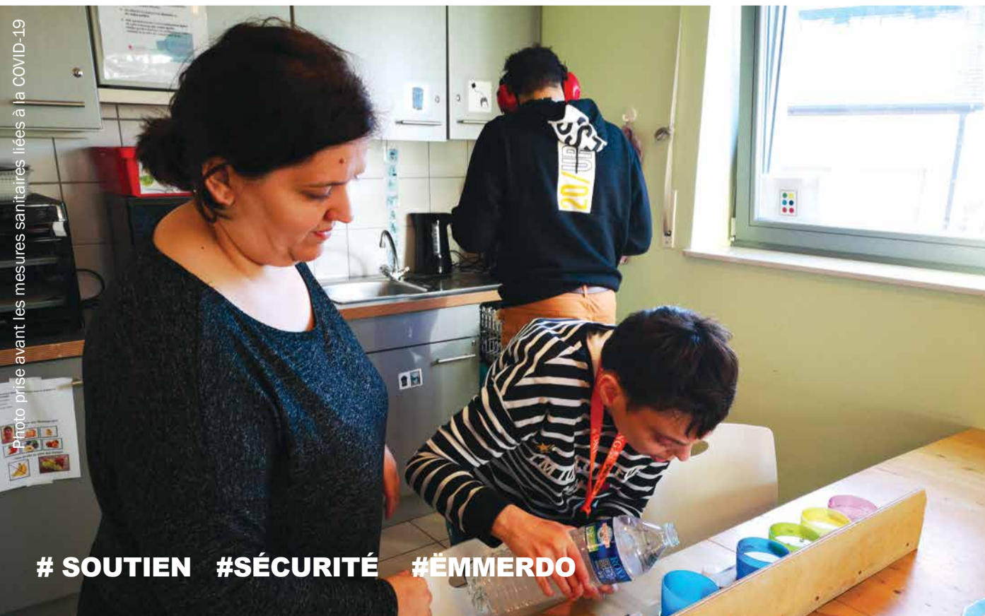
Photo prise avant les mesures sanitaires liées à la COVID-19